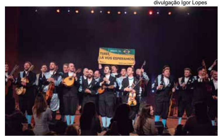
divulgação Igor Lopes