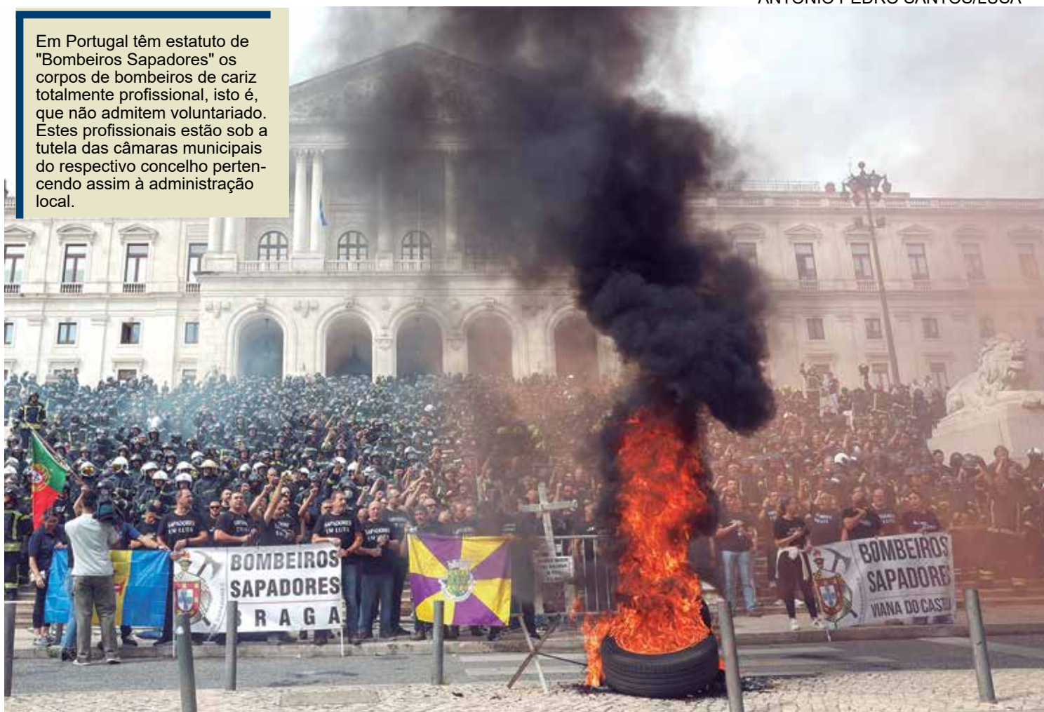
Bombeiros protestam em manifestação nacional em frente à Assembleia da República convocada pelo Sindicato Nacional dos Bombeiros Sapadores (SNBS) devido aos "graves problemas" e à "resposta indiferente e inaceitável" do governo.

Em Portugal têm estatuto de "Bombeiros Sapadores" os corpos de bombeiros de cariz totalmente profissional, isto é, que não admitem voluntariado. Estes profissionais estão sob a tutela das câmaras municipais do respectivo concelho pertencendo assim à administração local.