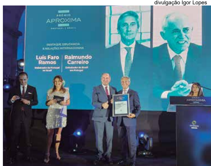
divulgação Igor Lopes O embaixador do Brasil em Portugal, Raimundo Carreiro Silva, e o embaixador de Portugal no Brasil, Luís Faro Ramos, foram dois dos nomes homenageados durante o prémio “Aproxima Portugal – Brasil”

“As relações do Brasil com Portugal são excelentes. E vem desde o ano de 1825 quando os dois países assinaram um Tratado de Amizade. (...) As relações comerciais e políticas são as mais perfeitas”, defendeu Raimundo Carreiro Silva, ao recordar que o Brasil convidou Portugal a participar nas reuniões do G20, sob a presidência do país irmão na América do Sul.