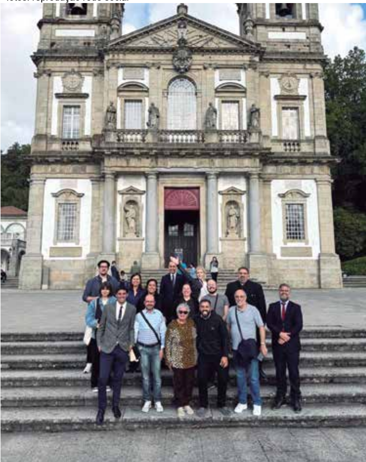
O grupo de dirigentes associativos ligados às entidades portuguesas que participaram em Portugal (na cidade de Braga) do "Curso Mundial de Formação de Dirigentes Associativos da Diáspora".

referiu ela com expectativa de trazer novidades para a entidade que dirige. "Foi uma experiência maravilhosa, cheia de aprendizado para desenvolver na Casa de Portugal de Campinas e no Rancho Folclórico da Casa de