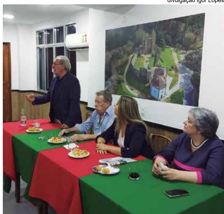
Durante a visita, as autoridades participaram em várias reuniões e encontros com autoridades locais, conselheiros e membros das comunidades.

“Conjuntamente com a Ministra da Juventude, Margarida Balseiro Lopes, encontrei-me com a seleção nacional universitária de futebol de praia,