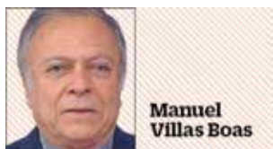
Manuel Villas Boas