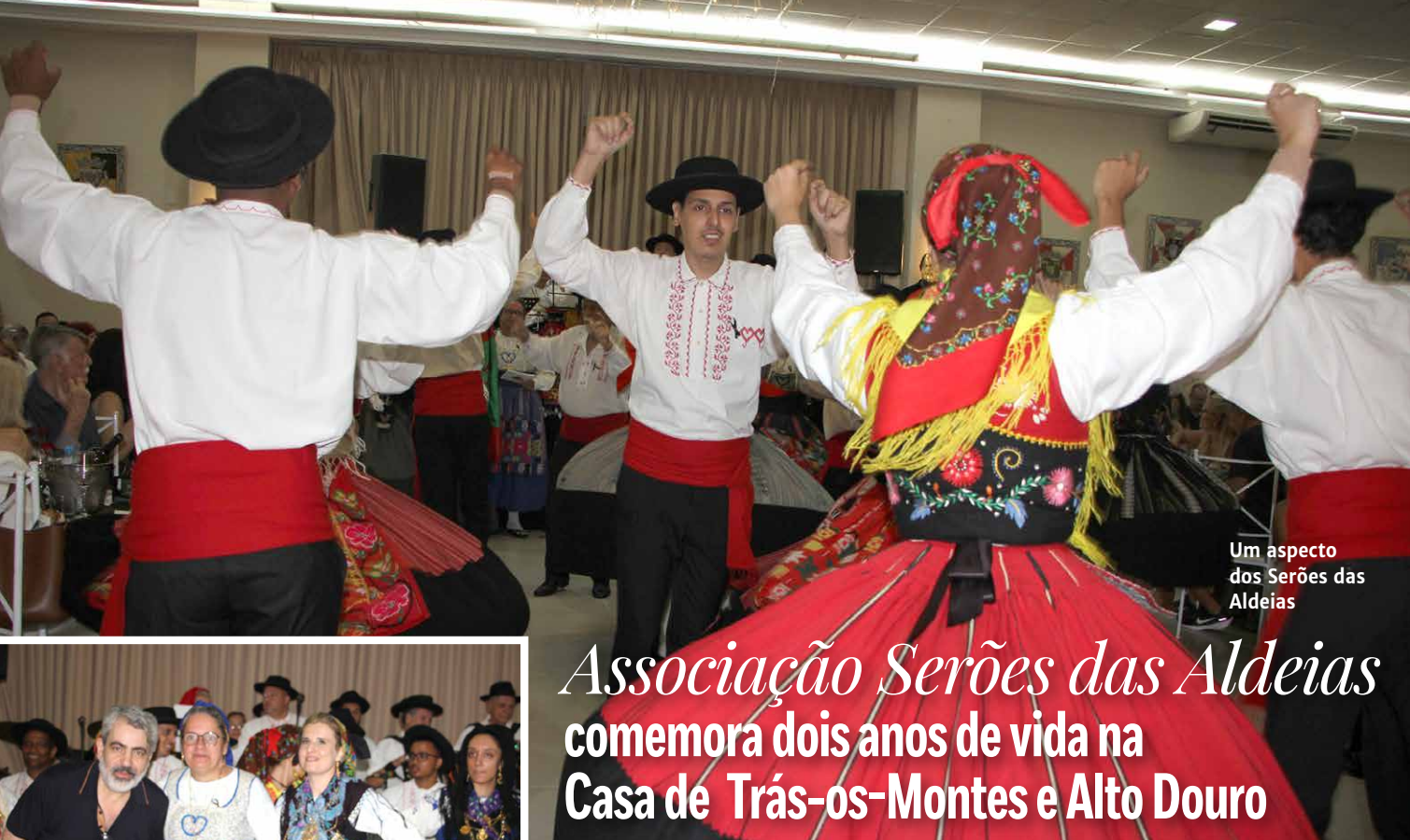
Um aspecto dos Serões das Aldeias