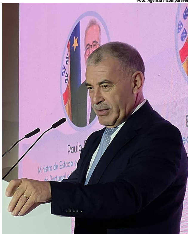
Emídio Sousa, Secretário de Estado das Comunidades Portuguesas

Secretário de Estado das Comunidades Portuguesas destacou, no âmbito das celebrações pelo “Dia da Comunidade Luso-Brasileira”, o papel estratégico da diáspora, reforçando os laços históricos e humanos entre Portugal e Brasil