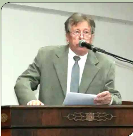
Palavras do presidente Ernesto Boaventura