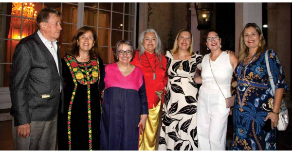
Embaixadora Isabel Pedrosa visita o Palácio São Clemente é momento importante para a Comunidade

Revista da Comunidade Luso-Brasileira • No Rio de Janeiro e Portugal • Edição - Março/Abril 2026