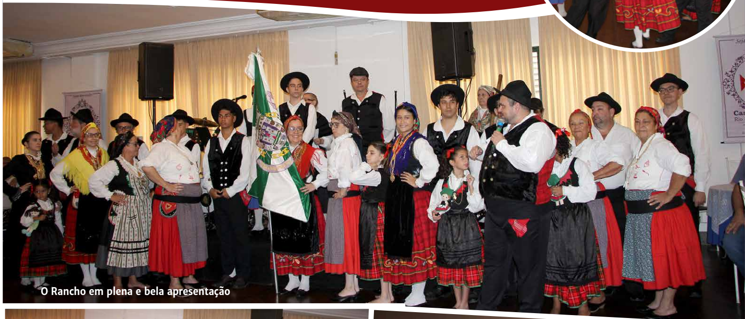
O Rancho em plena e bela apresentação