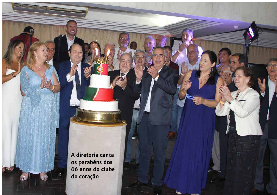
A diretoria canta os parabéns dos 66 anos do clube do coração