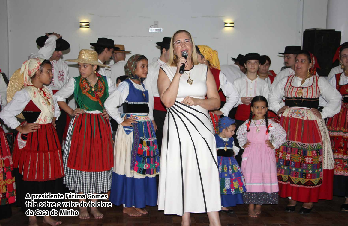
A presidente Fátima Gomes fala sobre o valor do folclore da Casa do Minho