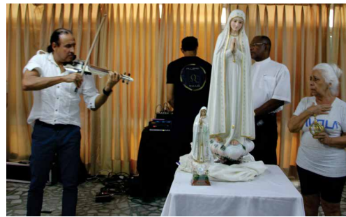
Clube Português de Niterói faz homenagem a NS. de Fátima e aos aniversariantes do mês