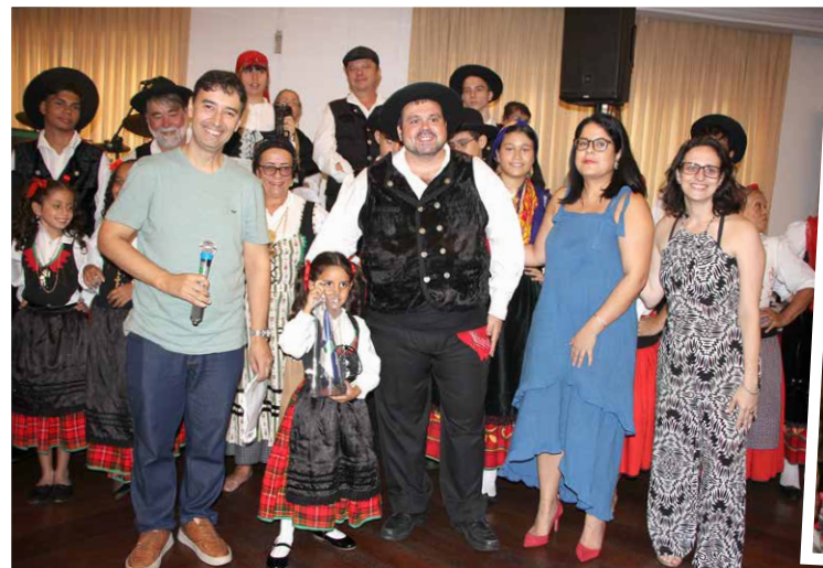
Grupo visitante troca homenagens com a diretoria da casa