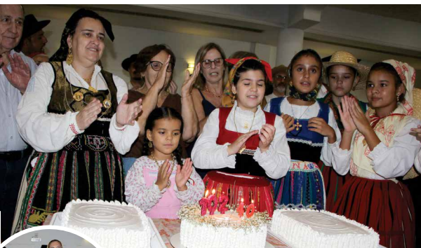
Casa do Minho comemora 102 anos de fundação e 40 de seu Folclore Juvenil

faz 66 Anos de muitos sucessos e vira palco de grandes celebrações