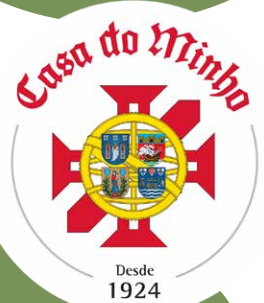
Os parabéns para a Casa do Minho e para seu Folclore Juvenil