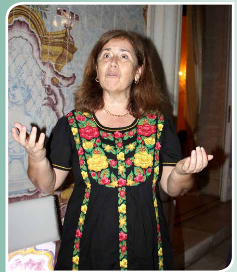
Palavras da nova Embaixadora