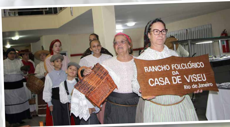
Chegada do Rancho Folclórico da casa de Viseu para a apresentação