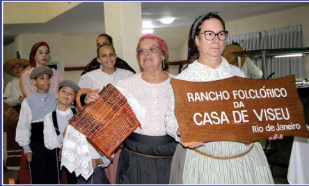
Casa de Viseu vive momentos de saudade e alegria com a Festa das Vindimas