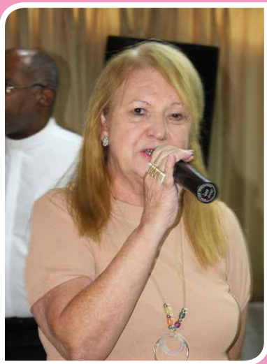
A primeira dama Rosa Coentrão durante a homenagem

Como acontece com regularidade mensal, o Clube Português de Niterói fez um almoço em torno de NS de Fátima, reunindo também os aniversariantes do mês. É momento de alegria, mas igualmente de religiosidade, uma vez que a santa é a padroeira da casa. Desta vez não foi diferente, e o Bacalhau foi o fator de destaque que superou expectativas e foi saboreado pelos convidados que lotaram o salão nobre do clube.