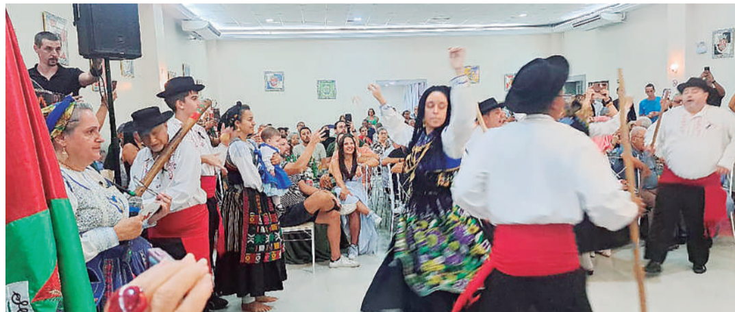
O GF aniversariante durante sua apresentação - sempre brilhante