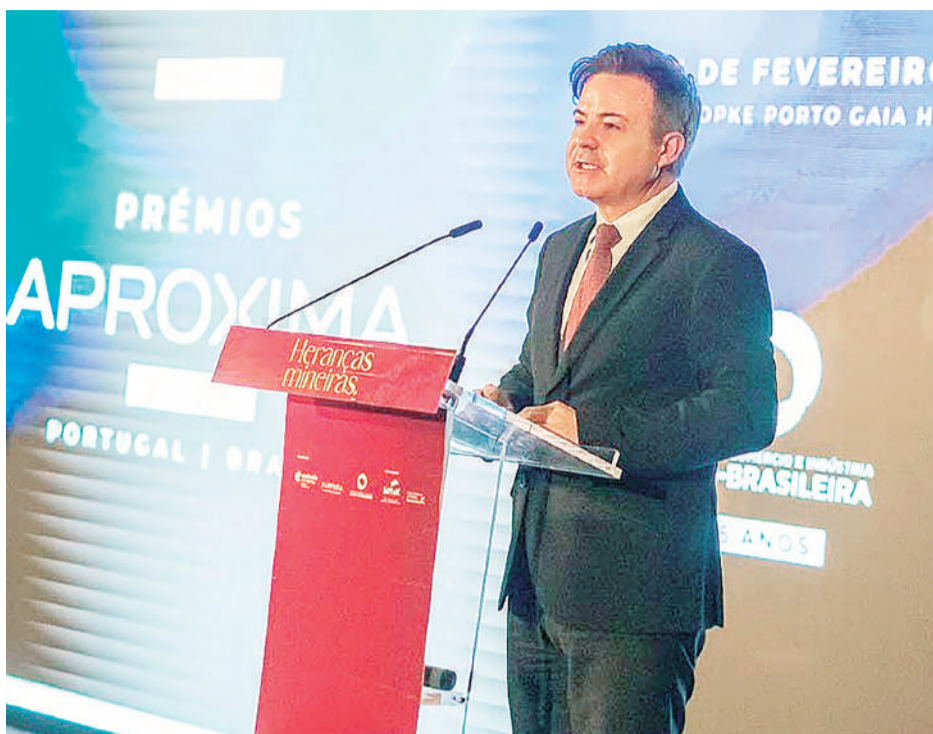
O secretário de estado da Cultura, Alberto Santos

reu em formato de almoço executivo com mesa redonda e teve como tema “Cultura, Língua e Criatividade: o soft power português do espaço luso-brasileiro para o mundo”.